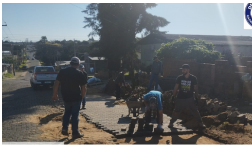
Restabelecimento de ruas danificadas