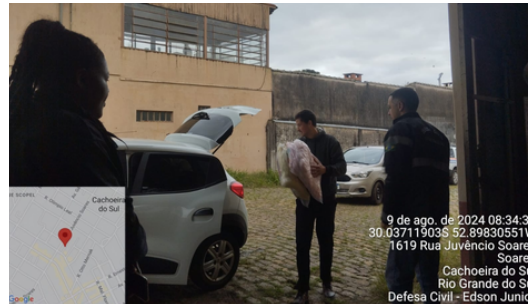
Entrega de ajuda humanitária famílias afetadas por inundaçào.