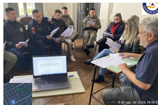
COMPDEC - Reunião para discussão do orçamento