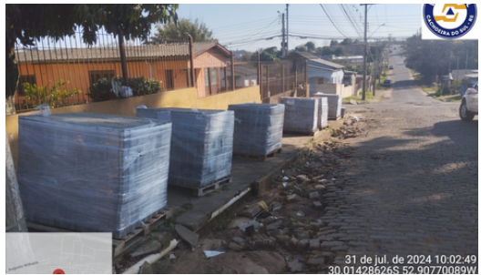
Restabelecimento de ruas danificadas