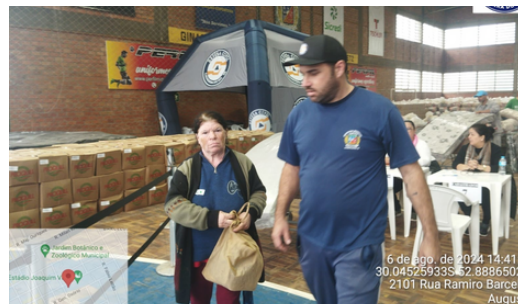
Entrega de ajuda humanitária famílias afetadas por inundaçào.