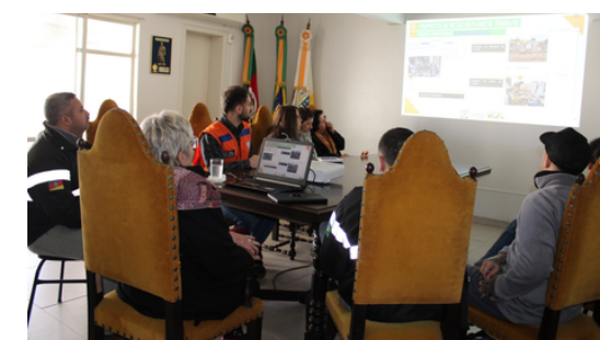
Reunião com técnico da Defesa Civil Nacional sobre Habitação