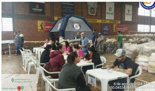
Entrega de ajuda humanitária famílias afetadas por inundaçào.