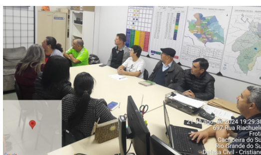
NUPDECs - Reunião com a UCAB para deinição dos Núcleos