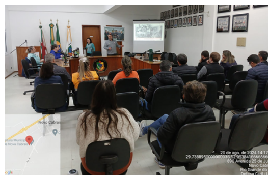
COREDE BAIXO JACUÍ - Apresentação da Defesa Civil Cachoeira do Sul