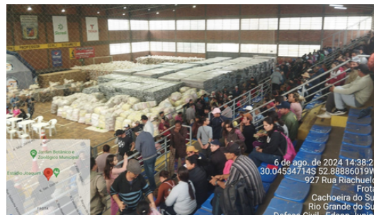
Entrega de ajuda humanitária famílias afetadas por inundaçào.