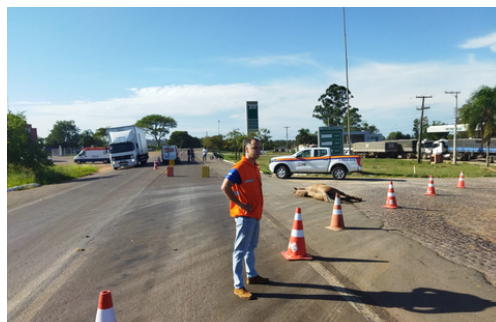
Acidente entre veículo e animal solto na pista BR 153