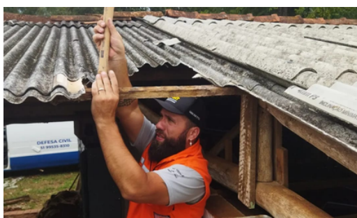
Atendimento a casa e instalações públicas destelhadas.