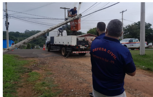
Retirada de poste em situação de risco