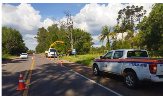
Retirada de árvores em situação de risco BR 290