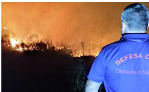
Incêndio em vegetação - Interior do Município