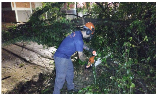
Retirada de árvores caídas sobre residências, veículos e via pública