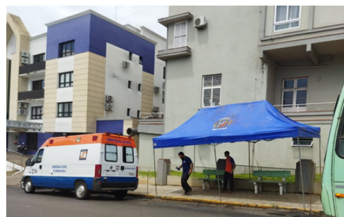
Interdição de parada de ônibus e instalação de tenda provisória.