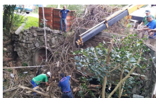
Retirada de resíduos de árvores de galeria arrastada por enxurrada.