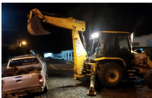
Retirada de veículo de buraco em via pública causado por colapso de rede