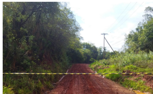
Interdição de vias públicas com risco de acidentes.